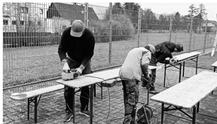
Zuerst wurde abgeschliffen .....

Am vergangenen Wochenende gingen einige Mitglieder des SVO daran, die etwas in die Jahre gekommenen Tischgarnituren vor dem Clubhaus auf Vordermann zu bringen. Mit viel Engagement ging es ans Werk, das Ergebnis kann sich sehen lassen. Viiiieen Dank!