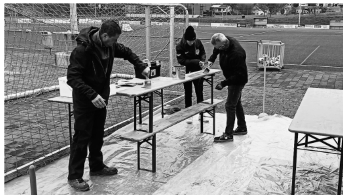
... dann gestrichen ....