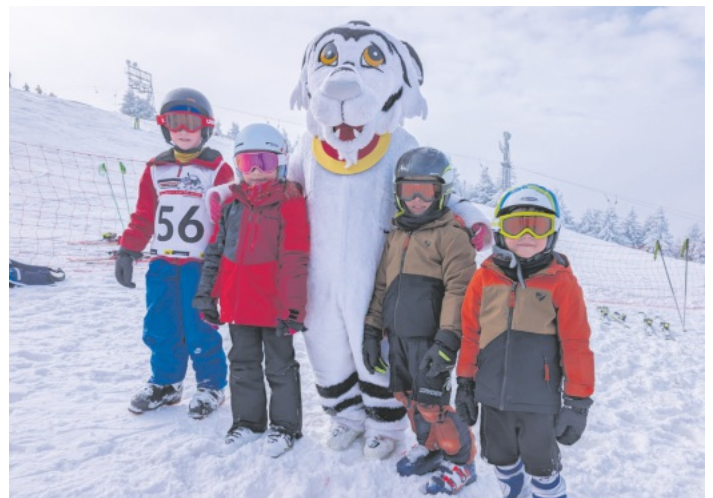
Gruppenbild mit Skitty