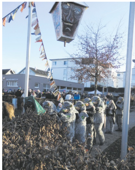
Die „Sackradde“ führten die Polonaise unter der Schudilampe hindurch an.