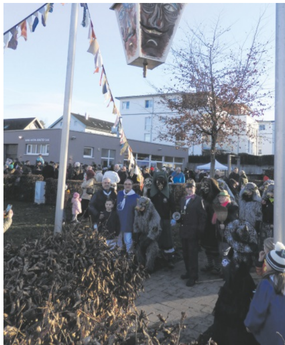
Alle örtlichen Schudigruppen unter der frisch installierten Schudilampe im Pfarrgarten.