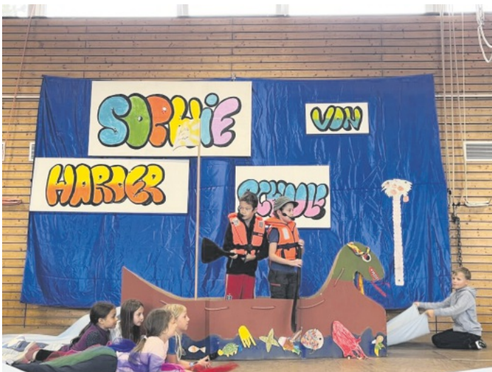
Theaterstück der Klasse 4